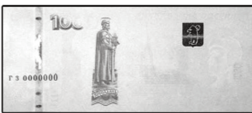
1000 рублей мод. 2010 г.