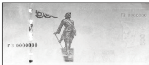
500 рублей мод. 2010 г.