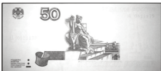
50 рублей мод. 2004 г.