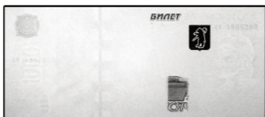
1000 рублей мод. 2004 г.