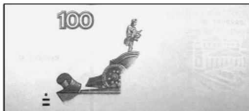
100 рублей мод. 2004 г.